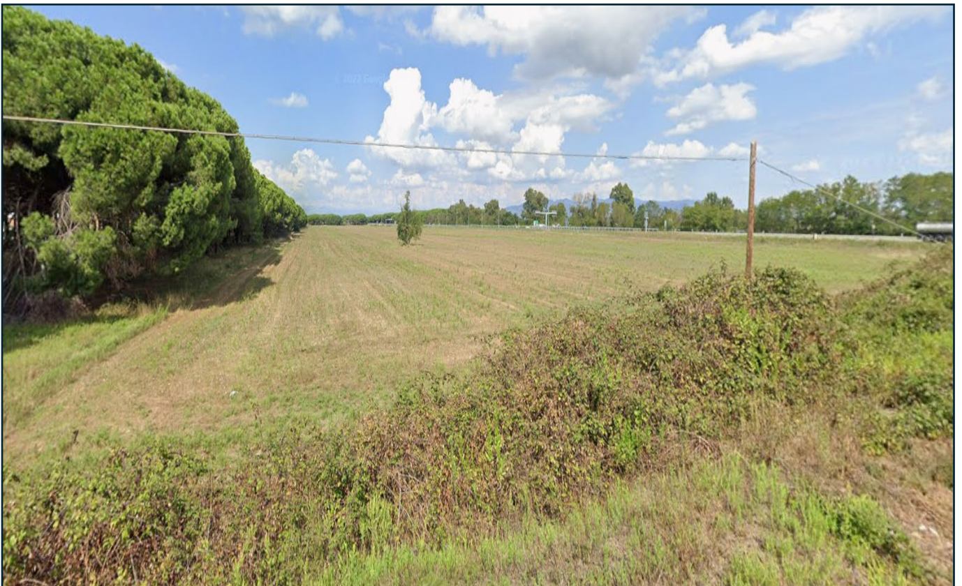
Veduta dei terreni dalla rampa di accesso al cavalcavia dell'Autostrada A-12