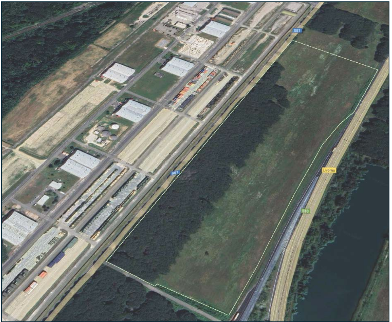
Veduta aerea terreni Lotto 2 (Google Maps)