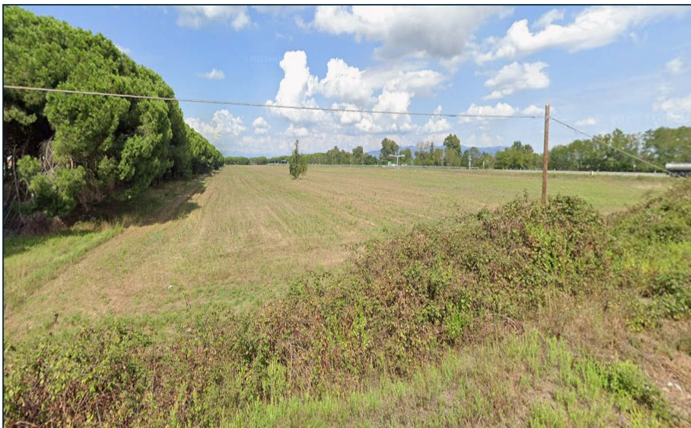
Veduta dei terreni dalla rampa di accesso al cavalcavia dell'Autostrada A-12