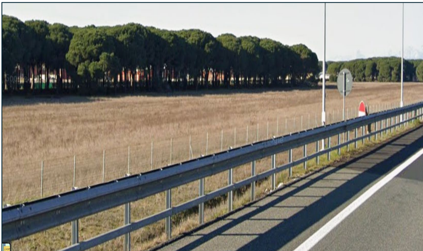
Altra veduta terreni dall' Autostrada A-12