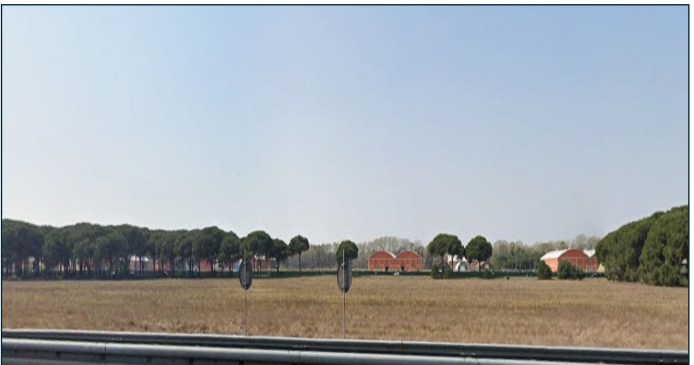
Veduta terreni dall' Autostrada A-12